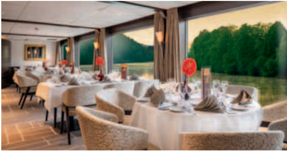
Stimmungsvolles Ambiente im Panorama-Restaurant