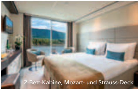
2-Bett-Kabine, Mozart- und Strauss-Deck